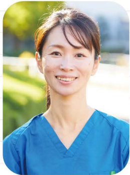
なごみ訪問看護ステーション 皮膚・排泄ケア特定認定看護師

A. フィルム材を3枚に分け、切り込みを入れる加工をして貼ってみましょう。シワや隙間を減らすことができ、より剥がれにくくなります。