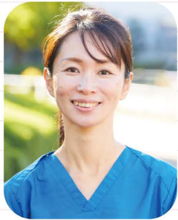
なごみ訪問看護ステーション 皮膚・排泄ケア特定認定看護師

2枚に分けて臀裂に貼り込むことで、よりシワや隙間を少なくし、排泄物を浸入しにくくできます。