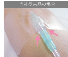
当社従来品の場合

伸縮性のあるやわらかいフィルムが、カテーテルと肌のすきまにもしっかり密着。細部までしっかりフィットして、すきまができにくくはがれにくい。