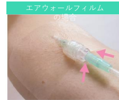
エアウォールフィルム の場合